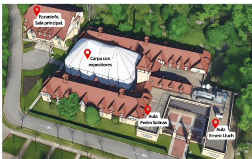
Esquema con localización del Paraninfo (Salón de actos), carpa de expositores instalada en el jardín de Las Caballerizas y aulas para las conferencias

Por su parte, la exposición técnica se ubicará en una carpa instalada en los jardines de las Caballerizas , ofreciendo un espacio abierto y luminoso que facilitará el encuentro entre participantes, empresas e instituciones en un entorno privilegiado.